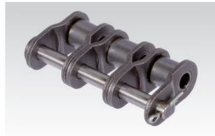
Nr. 12/L: gekröpftes Glied mit Splintverschluss