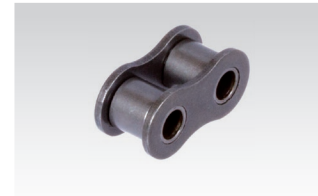
Nr. 4/B: Innenglied (3 Stück erforderlich)

Bestellangaben: z.B.: Artikel-Nr. 13100300, Verschluss Nr. 11/E, 06 B-3