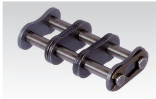
Nr. 11/E: Steckglied mit Federverschluss Nr. 10/S: Steckglied mit Splintverschluss